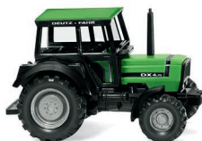
0386 02 Deutz-Fahr DX 4.70 UVP 9,99 €