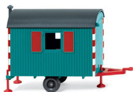
0656 07 Bauwagen UVP 9,99 €