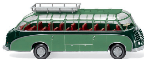
0730 02 Reisebus (Setra S8) UVP 17,99 €