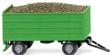
0388 15 Rübenanhänger UVP 7,99 €