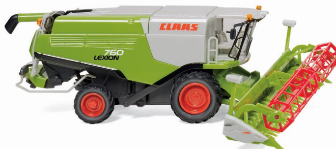
0389 14 Claas Lexion 760 Mährescher mit V 1050 Getreidevorsatz UVP 30,49 €

Modellhistorie aus fünf Jahrzehnten präsentiert WIKING zum Ausklang des Programmjahres 2018: So fahren das VW Karmann Ghia Coupé als "Gelb-Schwarzer Renner", aber auch das Glas Goggomobil sowie der Opel Caravan '57 ins Programm. Dem traditionsreichen Modelltrio der 1950er- und 1960er-Jahre hat WIKING ein aufwändiges Finishing gewidmet – der Opel Freizeitkombi überrascht mit zweifarbiger Flankengestaltung sowie einem zeit-