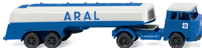
0806 98 Tanksattelzug (Henschel HS 14/16) UVP 19,99 €