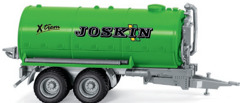
0382 38 Joskin Vakuumfasswagen UVP 11,99 €