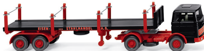
0518 45 Rungensattelzug (MB 1620) UVP 19,99 €