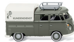
0789 05 VW T1 Doppelkabine UVP 15,99 €