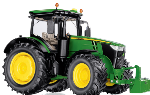
0778 37 John Deere 7310R UVP 84,95 €