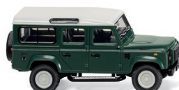
0102 02 Land Rover Defender 110 UVP 16,99 €