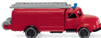
0610 02 Feuerwehr – Spritzenwagen (Magirus S 3500) UVP 13,49 €