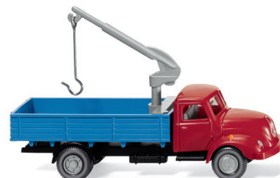
0420 02 Pritschen-Lkw mit Ladekran (Magirus S 3500) UVP 13,99 €