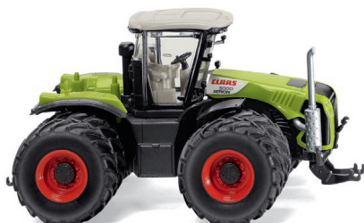
0363 98 Claas Xerion 5000 mit Zwillingsbereifung UVP 18,99 €