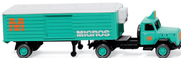
0520 03 Kühlkoffersattelzug (Magirus) UVP 19,99 €