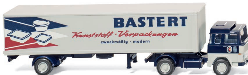
0547 01 Koffersattelzug (Magirus) UVP 20,99 €