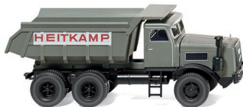
0866 36 Muldenkipper (Kaelble) UVP 17,99 €