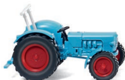
0871 42 Eicher Königstiger UVP 10,49 €