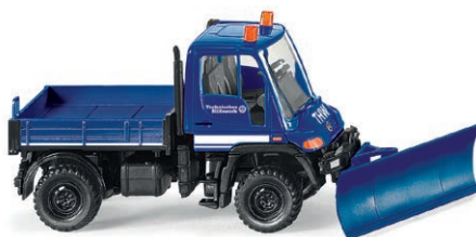
0693 22 THW - Unimog U 400 mit Räumschild UVP 19,99 €