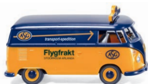
0797 13 VW T1 Kastenwagen UVP 13,99 €