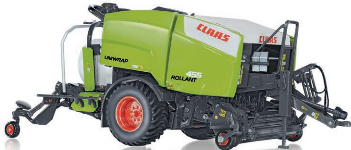
0773 20 Claas Uniwrap Rollant 455 · UVP 69,95 €