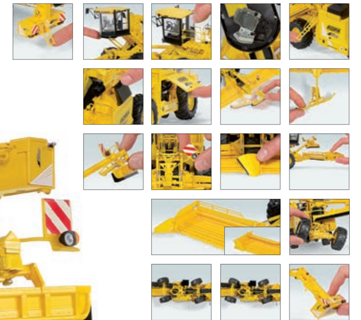
0773 12 ROPA EuroMaus4 · UVP 149,95 €