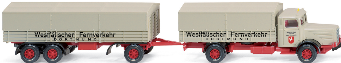
0858 05 Pritschenlastzug (Büssing 8000) UVP 21,99 €