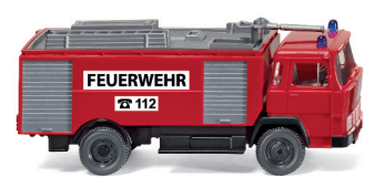
Bestandteile Set „Feuerwehr im Einsatz“ 0990 81

Der Themen-Mix überzeugt zum WIKING-Jahresausklang: Die beiden topaktuellen Modellkarossen VW Touareg und VW T5 als Claas-Servicefahrzeug werden ergänzt durch die imposante Hubrettungsstufe auf Eonic-Fahrgestell nach Vorbild der Metz B32 – sie brilliert durch vorbildgerechte Funktionalität aller beweglichen Teile. Derweil erinnern die weiteren Klassiker an alle automobilen Epochen des letzten Jahrhunderts. So gibt es ein Wiedersehen mit dem Horch