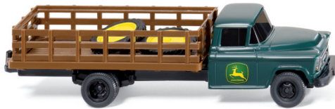
0444 01 US Lkw mit Gitteraufbau UVP 10,99 €