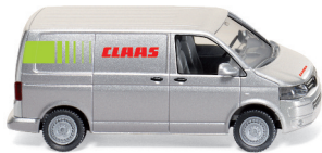
0309 05 VW T5 GP Kastenwagen UVP 16,49 €