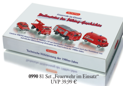
0990 81 Set „Feuerwehr im Einsatz“ UVP 39,99 €

Der Themen-Mix überzeugt zum WIKING-Jahresausklang: Die beiden topaktuellen Modellkarossen VW Touareg und VW T5 als Claas-Servicefahrzeug werden ergänzt durch die imposante Hubrettungsstufe auf Eonic-Fahrgestell nach Vorbild der Metz B32 – sie brilliert durch vorbildgerechte Funktionalität aller beweglichen Teile. Derweil erinnern die weiteren Klassiker an alle automobilen Epochen des letzten Jahrhunderts. So gibt es ein Wiedersehen mit dem Horch