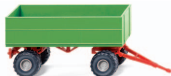
0388 39 Landwirtschaftlicher Anhänger UVP 5,99 €