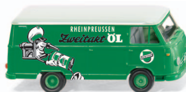
0270 47 Borgward Kastenwagen B611 UVP 12,49 €