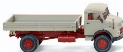
0895 04 Pritschenkipper (MB LAK 710) UVP 13,99 €