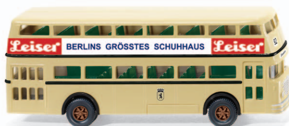
0722 03 Doppeldeckerbus D2U (Büssing) UVP 17,99 €

Youngtimer und bewährte Klassiker führt WIKING gelungen zusammen: Besonders die legendäre Parkhalle dürfen die Markenenthusiasten einmal mehr in ihre Sammlung historischer WIKING-Modelle einreihen. Nur wenige Jahre war einst das Fertigmodell aus dem Zubehörprogramm der Traditionsmodellbauer erhältlich, ehe seine Formen für Jahrzehnte im Archiv verschwanden. Unterdessen gibt sich der BMW