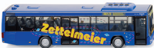
0707 02 MAN Lion's City A78 UVP 23,99 €