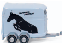
0066 04 Pferdeanhänger UVP 7,99 €