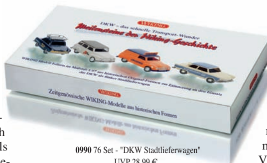
0990 76 Set - "DKW Stadtlieferwagen" UVP 28,99 €

Auf dieses Spezialfahrzeug haben Modell-enthusiasten schon lange gewartet: WIKING stellt erstmals eine Hubrettungsstufe vor, die nach dem Metz Vorbild B32 mit hoher Investitionskraft in neue Formen als voll funktionsfähige Präzisionsminiatur konzipiert und 87-fach verkleinert wurde. Viele Details am Aufbau, aber vor allem der teleskopierbare Hubrettungskorb begeistern. In einmaliger Auslieferung erscheint überdies ein zeitgenössisches DKW-Themen-Set, das auf die Alltagstauglichkeit des Universals und des Juniors als flinke Stadtlieferwagen zurückblickt. Pkw-Freunde finden mit