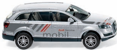
0133 05 Audi Q7 UVP 14,49 €