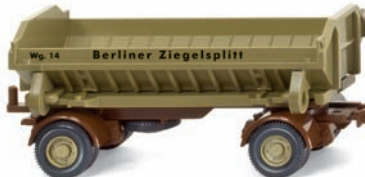
0850 49 Hanomag mit Muldenkipper-Anhänger UVP 14,99 €