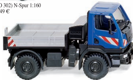
0369 02 Unimog U20 UVP 13,69 €