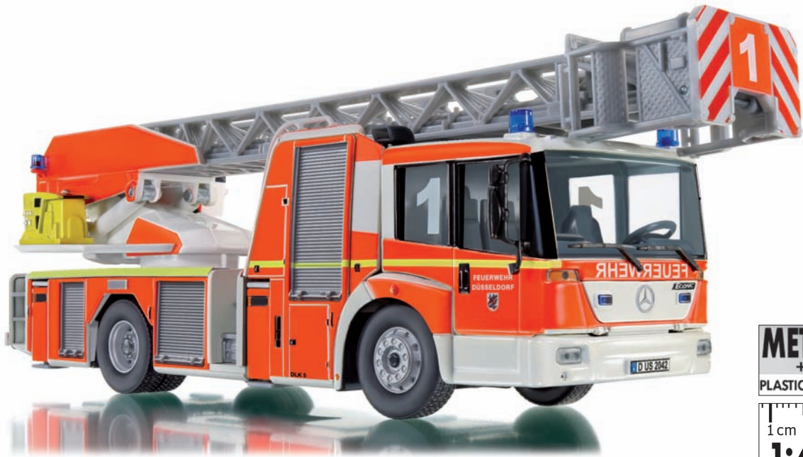
0431 02 Feuerwehr - DL 32 (MB Eonic) UVP 69,95 €