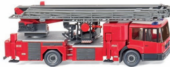
0628 49 Hubrettungsstufe Metz B32 (MB Eonic) UVP 29,99 €