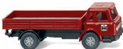
0446 01 Pritschen-Lkw (International Harvester) UVP 10,99 €