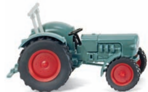
0871 41 Eicher Königstiger UVP 9,99 €

W IKING erinnert an das Jubiläum der Markteinführung des legendären britischen Roadsters: 50 Jahre Jaguar E-Type – der zum Synonym für die stilvolle englische Sportwagentradition geworden ist. Außerdem kommt der filigrane Schlepper-Klassiker aus dem Hause Eicher zur Auslieferung. Der Königstiger vollzieht die nuancierte Farbaktualisierung der damaligen Traktorschmiede nach. Darüber hinaus gibt es ein Wiedersehen mit dem über vier Jahrzehnte alten Muldenkippl-Anhänger, für den WIKING die historischen Formen revitalisierte und damit zugleich ein Pendant zum vorbildgleichen Hanomag-Neuheitengespann bereitstellt. Der Unimog U20 und der