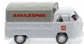
0316 02 VW T2 mit Plane UVP 8,99 €