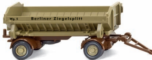
0675 49 Muldenkippl-Anhänger UVP 6,99 €