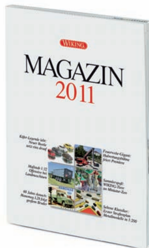
0006 18 WIKING Magazin 2011 UVP 10,00 €

W IKING erinnert an das Jubiläum der Markteinführung des legendären britischen Roadsters: 50 Jahre Jaguar E-Type – der zum Synonym für die stilvolle englische Sportwagentradition geworden ist. Außerdem kommt der filigrane Schlepper-Klassiker aus dem Hause Eicher zur Auslieferung. Der Königstiger vollzieht die nuancierte Farbaktualisierung der damaligen Traktorschmiede nach. Darüber hinaus gibt es ein Wiedersehen mit dem über vier Jahrzehnte alten Muldenkippl-Anhänger, für den WIKING die historischen Formen revitalisierte und damit zugleich ein Pendant zum vorbildgleichen Hanomag-Neuheitengespann bereitstellt. Der Unimog U20 und der