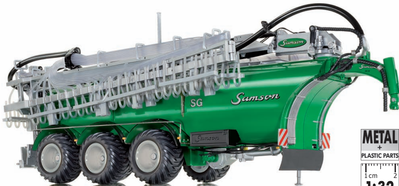
0773 11 Samson Fasswagen SG28 UVP 99,95 €

E s ist ein wirklicher Präzisionsmodell-Gigant: Mit dem Samson Güllewagen SG28 setzt WIKING neue Maßstäbe bei den Land-