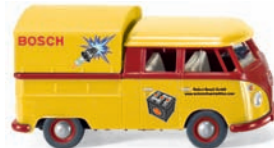
0789 03 VW T1 Doppelkabine mit Plane UVP 15,99 €