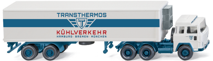
0528 49 Kühlkoffersattelzug (Magirus 235 D) UVP 19,99€

Beides sind Klassiker, die untrennbar mit der deutschen Nachkriegsgeschichte verbunden sind: WIKING stellt mit der August-Auslieferung das Glas Goggomobil mit filigranem Faltdach und den Ford FK 1000 als Kastenwagen vor. Beide Neuheiten erscheinen dank typischer WIKING-Handschrift filigran detailliert und komfortbedruckt. Darüber hinaus bringen der Ford Granada als Polizeifahrzeug und der Magirus 235 D