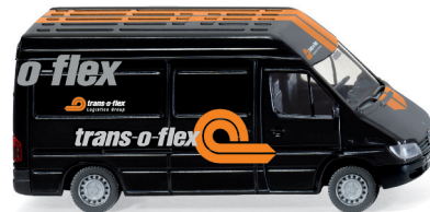
0285 49 MB Sprinter - Kastenwagen UVP 11,49€