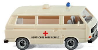
0320 02 DRK - VW T3 Bus UVP 11,49€