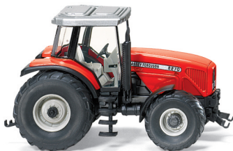
0385 05 Massey Ferguson MF 8270 UVP 12,49€