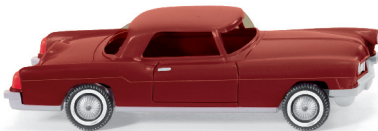
0210 01 Ford Lincoln Continental UVP 11,49€