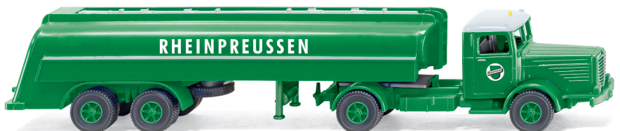
0882 49 Tanksattelzug (Büssing 8000) UVP 18,99€

Vier Jahrzehnte Automobilgeschichte – WIKING führt die Epochen in der Modellpflege facetten- und spannungsreich zusammen. Mit der legendären Brennstoffmarke „Rheinpreussen“ fährt der Tanksattelzug Büssing 8000 ins Programm, während der Ford Lincoln Continental und die MB Pagode als gestandene Chromklassiker die 1960er-Jahre Re-