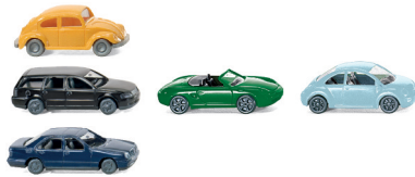
0918 08 Set mit 3 verschiedenen Pkw (Mix) N-Spur 1:160 UVP 7,99€