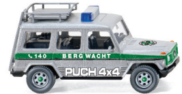
0278 03 Puch G UVP 14,99€