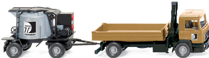
0689 03 Gussasphaltkocher-Hängerzug (MAN F 90) UVP 17,49€