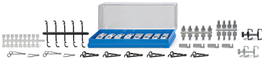
0018 05 Zubehörpackung - Verbindungen UVP 9,99€