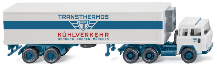
0528 49 Kühlkoffersattelzug (Magirus 235 D) UVP 19,99€

Beides sind Klassiker, die untrennbar mit der deutschen Nachkriegsgeschichte verbunden sind: WIKING stellt mit der August-Auslieferung das Glas Goggomobil mit filigranem Faltdach und den Ford FK 1000 als Kastenwagen vor. Beide Neuheiten erscheinen dank typischer WIKING-Handschrift filigran detailliert und komfortbedruckt. Darüber hinaus bringen der Ford Granada als Polizeifahrzeug und der Magirus 235 D