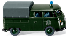
0864 19 Polizei - VW T1 Doppelkabine mit Plane UVP 12,99€