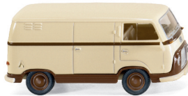
0289 01 Ford FK 1000 Kastenwagen UVP 11,99€