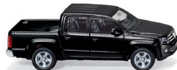
0311 02 VW Amarok UVP 18,89 €