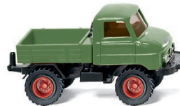
0371 03 Unimog U 411 UVP 8,99 €