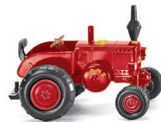
0880 04 Lanz Bulldog UVP 6,99 €