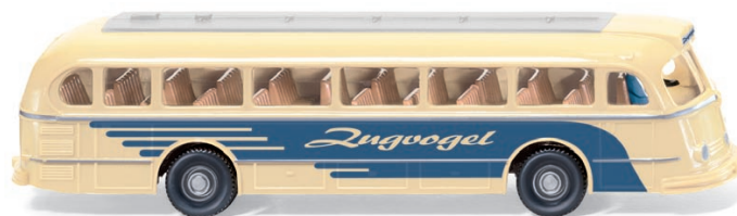
0700 01 Autobus (MB O 6600 H Pullman) UVP 15,49 €

Dieser Autobus versprüht den WIKING-Charme der 1960er-Jahre: Der Mercedes-Benz O 6600 H Pullman erfährt mit der Februar-Modellpflege ein zeitgenössisch liebevolles Finishing – der Bus-Klassiker macht seinem Namen als „Zugvogel“ alle Ehre und zieht die Blicke der Sammler auf sich. Außerdem gibt es ein Wiedersehen mit dem Lanz Bulldog, dem geschlossenen Unimog U 411 sowie der legendären Ente von Citroën.