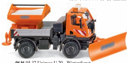
0646 05 37 Unimog U 20 - Winterdienst