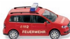
0601 20 33 Feuerwehr - VW Touran GP