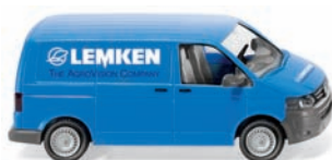
0309 04 34 VW T5 GP Kastenwagen