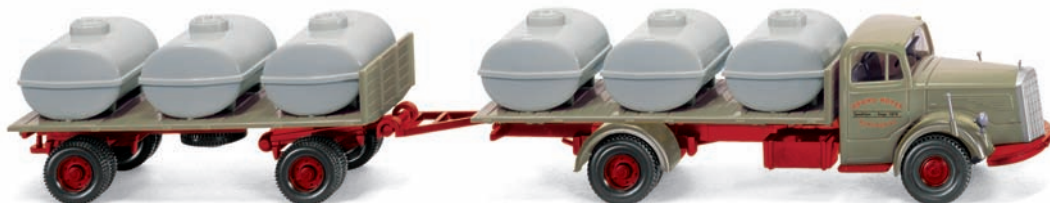
0859 40 40 Behelfstanzug (MB LP 6600)

K raftvoller Auftritt für einen Mercedes Benz-Klassiker erster Güte: WIKING stellt den LP 6600 als Behelfstanzug vor – ein attraktives Haubergespann, dessen Vorbild einst in Diensten der Spedition Hoyer stand. Überdies rüsten sich in 1:87 zwei Unimog für den Spezialeinsatz: Der U 20 hat sich fit für den Winterdienst gemacht, der U 1700 befördert die Kabeltrommel zur Baustelle. Außerdem belebt ein zeitgenössisches Rübenertegespann das Landwirtschaftsthema. Dem kraftstrotzenden Schlüter 1250 VL stehen dabei gleich zwei Anhänger gut