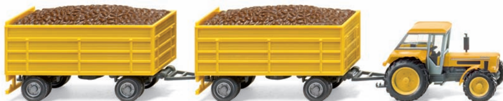
0875 02 42 Schlüter 1250 VL mit 2 Rübenanhängern