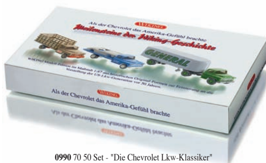
0990 70 50 Set - "Die Chevrolet Lkw-Klassiker"

K raftvoller Auftritt für einen Mercedes Benz-Klassiker erster Güte: WIKING stellt den LP 6600 als Behelfstanzug vor – ein attraktives Haubergespann, dessen Vorbild einst in Diensten der Spedition Hoyer stand. Überdies rüsten sich in 1:87 zwei Unimog für den Spezialeinsatz: Der U 20 hat sich fit für den Winterdienst gemacht, der U 1700 befördert die Kabeltrommel zur Baustelle. Außerdem belebt ein zeitgenössisches Rübenertegespann das Landwirtschaftsthema. Dem kraftstrotzenden Schlüter 1250 VL stehen dabei gleich zwei Anhänger gut