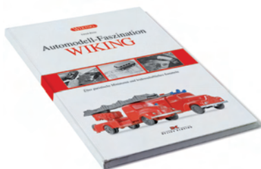
0006 42 00 Buch III Faszination WIKING

Wenn es um topaktuelle Verkehrsmodelle geht, ist die Neuheiten-Auslieferung an den nationalen Fachhandel eine gute Empfehlung. Denn der VW T5 erhält mit dem Modell „Pan Americana“ sein vorbildgerechtes Facing, das sich damit nahtlos in die Typenfamilie der Wolfsburger Autobauer einreicht. Außerdem fährt die leichte Einstiegsklasse von MAN mit dem TGL als Abschleppwagen ins Programm. Sammler dürfen sich dabei über fünf unterschiedliche PKW-Beladungen aus dem Klassiker-Programm freuen. Überdies gibt es ein Wiedersehen mit einem Youngtimer-Trio der 1970er-Jahre: Der VW Golf I