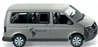
0308 40 36 VW Multivan