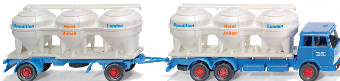
0575 05 42 Silo-Lastzug (Hanomag-Henschel F161)

Wenn es um topaktuelle Verkehrsmodelle geht, ist die Neuheiten-Auslieferung an den nationalen Fachhandel eine gute Empfehlung. Denn der VW T5 erhält mit dem Modell „Pan Americana“ sein vorbildgerechtes Facing, das sich damit nahtlos in die Typenfamilie der Wolfsburger Autobauer einreicht. Außerdem fährt die leichte Einstiegsklasse von MAN mit dem TGL als Abschleppwagen ins Programm. Sammler dürfen sich dabei über fünf unterschiedliche PKW-Beladungen aus dem Klassiker-Programm freuen. Überdies gibt es ein Wiedersehen mit einem Youngtimer-Trio der 1970er-Jahre: Der VW Golf I