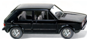
0045 01 27 VW Golf I GTI 2-Türer