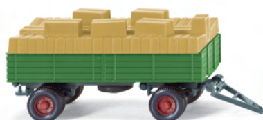
0879 04 23 Landwirtschaftlicher Anhänger