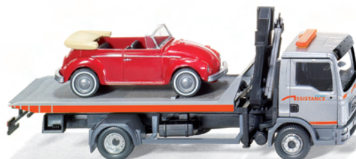
0636 06 46 Abschleppwagen (MAN TGL) mit einem der gezeigten PKW als Ladegut