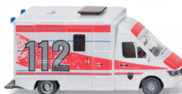
0321 05 31 Rettungswagen – FW Siegen (MB Sprinter)