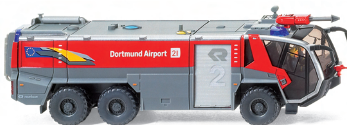
0626 04 46 Feuerwehr Dortmund – FLF Panther 6x6 (Rosenbauer)

Die Mischung macht's – WIKING liefert mit der April-Modellpflege den Beweis dafür, dass der Maßstab 1:87 voller Themenreize steckt! So erfreut die Rückkehr von Opel Admiral und Citroën DS 23 Pallas die Freunde der historischen WIKING-Miniaturen. Beide Modelle entstammen revitalisierten Formen und werden mit hohem Bedruckungskomfort vorbildgerecht veredelt. Ebenfalls zum historischen