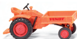
0899 41 25 Fendt Geräteträger