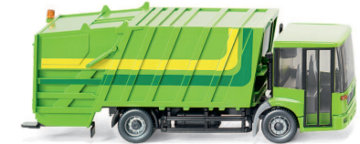
0638 04 35 Pressmillwagen (MB Eonic)