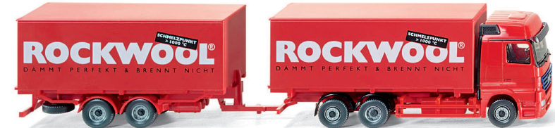
0599 06 42 Wechselkoffer-Zentralachshängerzug (MB Actros)

So reizvoll kann die Autowelt im Maßstab 1:87 sein: Zu einer außergewöhnlichen WIKING-Mission startet ein VW Touareg Gespann, das als ungewöhnliche Fracht die „Zwickauer Rennpappe“ geladen hat – der einstige DDR-Bestseller der Rettungswagen mit Fahrgestell der Mercedes Sprinter in DRK-