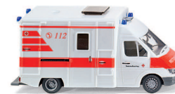
0321 04 30 Rettungswagen - RTW (MB Sprinter)