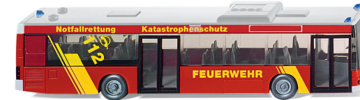
0706 03 42 Feuerwehr - MAN Linienbus