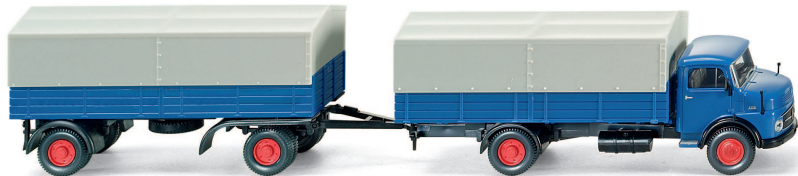
0852 01 39 Pritschen-Lastzug (MB L1113)